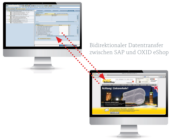
Bidirektionaler Datentransfer zwischen SAP und OXID eShop